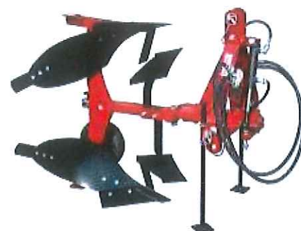
RHM30AC8 + ZRM30 + ROUERM30